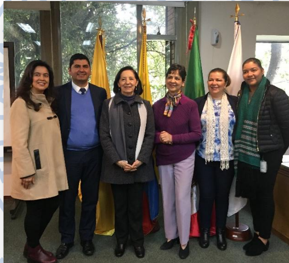
Reunión de directivos del IGAC y la embajadora de México para Colombia.